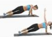
19 Side Plank Reach