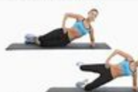
35 Side Hip Abduct