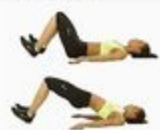
31 Butt Bridge