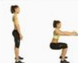
26 Wall Sit