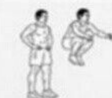
jump knee tucks