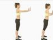
7 Wall Push-up