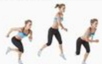
32 Side Skater Jump