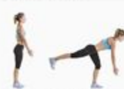
34 One-Leg RDL