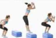
33 Box Jump