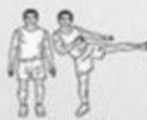
side leg raises