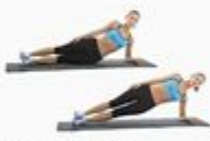
18 Side Plank