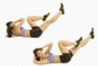
23 Bicycle Crunch